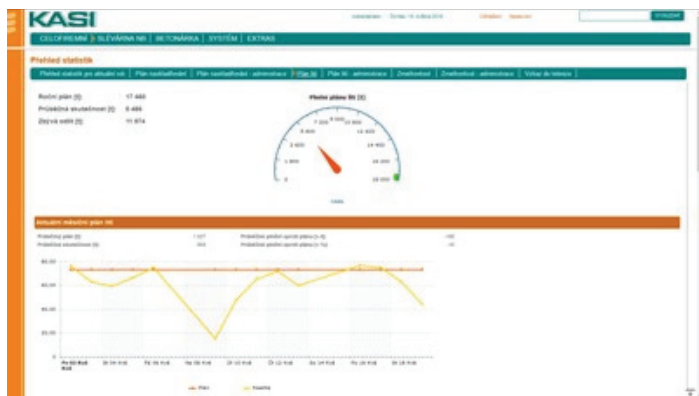
Snímek obrazovky 1 : Současný stav ve výrobě